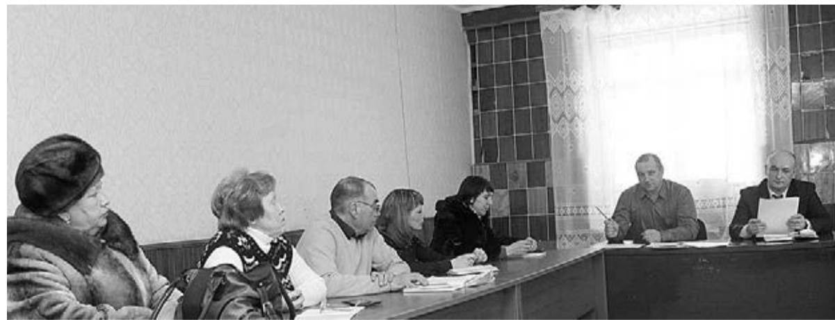
На круглом столе — о капремонте домов.

Нешуточные баталии разразились 18 февраля между специалистами сельской администрации и представителями многоквартирных домов. В здании Баганского сельсовета прошел круглый стол на животрепещущую тему «Новый закон о капремонте жилья».